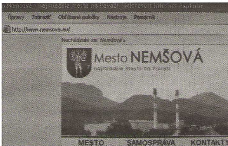
Webovú stránku s koncovkou .eu už používa mesto Nemšová.